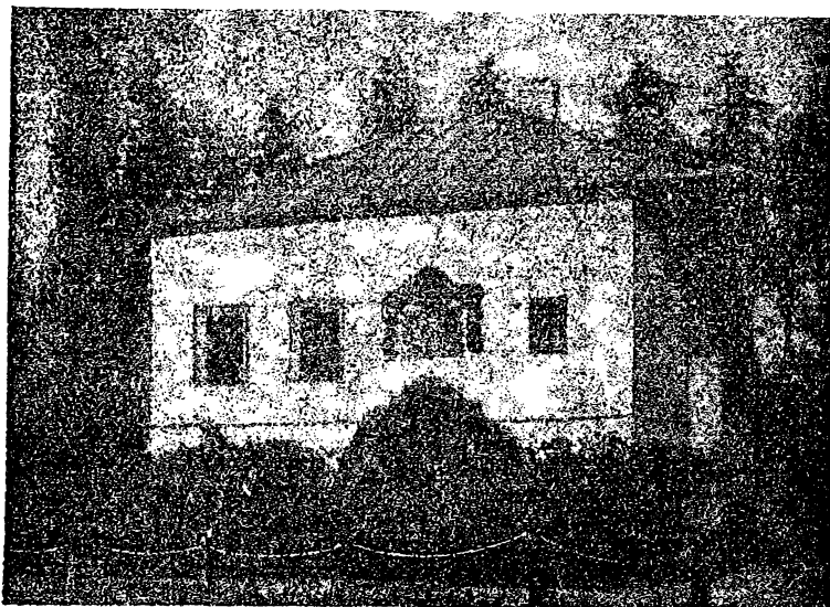
BETHLEN GÁBOR SZÜLŐHÁZA