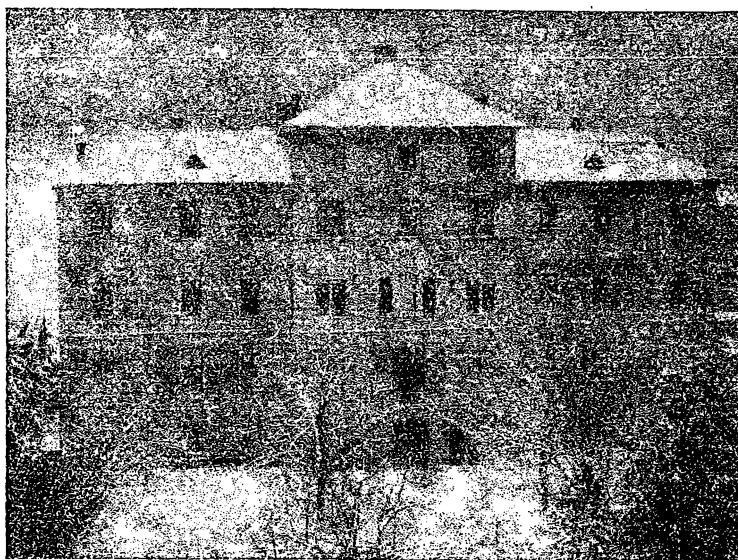
A leányinternátussal kibővített kolozsvári ref. Szeretetház

Megjelenik minden hónapban kétszer - Előfizetési díja félévre 60 Lei. Egész évre 120 Lei Szerkesztőség és kiadóhivatal: Cluj-Kolozsvár, Calea Victoriei 38 Kéziratok, előfizetési díjak ide küldendők