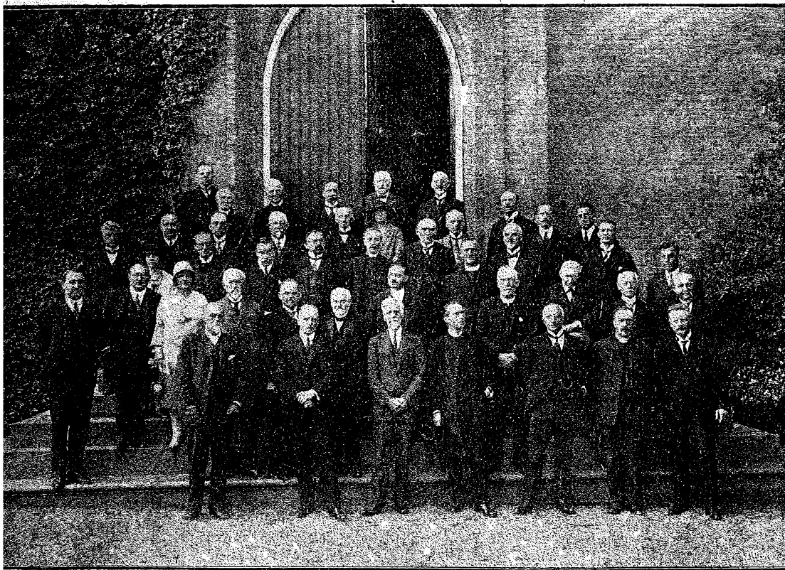
A REF. EGYHÁZAK VILÁGSZÖVETSÉGÉNEK JELENLEGI VEZETŐI