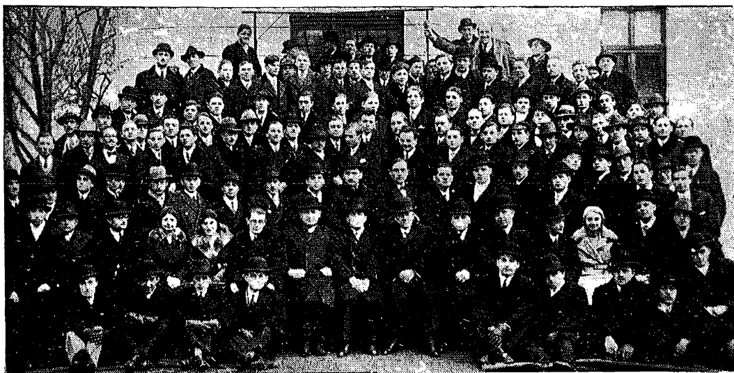
A konferencia résztvevői.