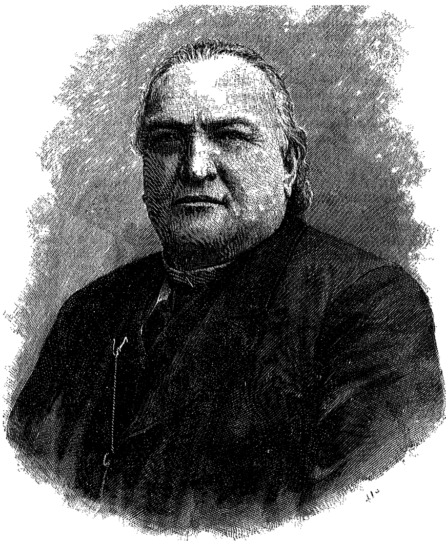
Szász Domokos, az Erdélyi Református Egyházkerület nagy építő püspöke (1884–1899). Morelli Gusztáv metszete

Az Erdélyi Református Theológiai Fakultás jubileuma