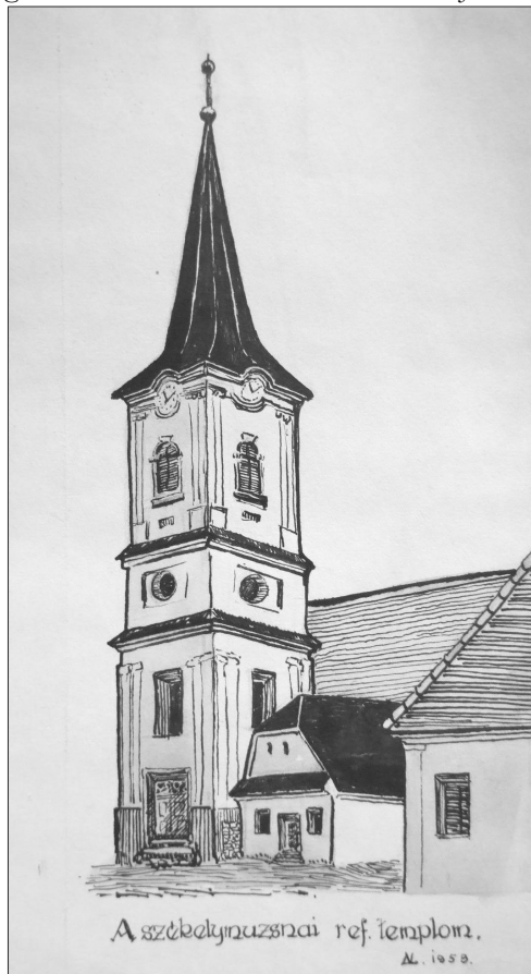
A székelymúzsnai református templom Dávid László grafikája (1958)

Szelíd és békés ember volt – természete szerint, de a Krisztus tanítványainak adott parancsnak is engedelmessé. Ez a jótékony légkör sugárzott mindig környezetében. Egyházmegyei előjáróként ezért kapta sokszor azt a megbízatást, hogy békét teremtsen a nyugtalanná lett hívek között; s bár ez nehéz és némelykor szinte reménytelen feladatot jelentett számára, öröme lehetett Jézus mondása szerint: Boldogok, akik békét teremtenek, mert ők Isten fiainak neveztetnek. (Mt 5,9)