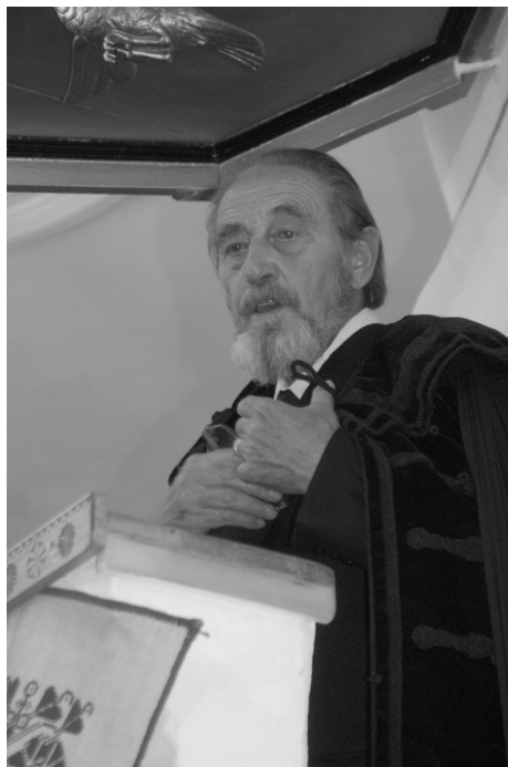
Utolsó szolgálata közben, szülőfalujában, Árapatakon, 2007. július 28-án