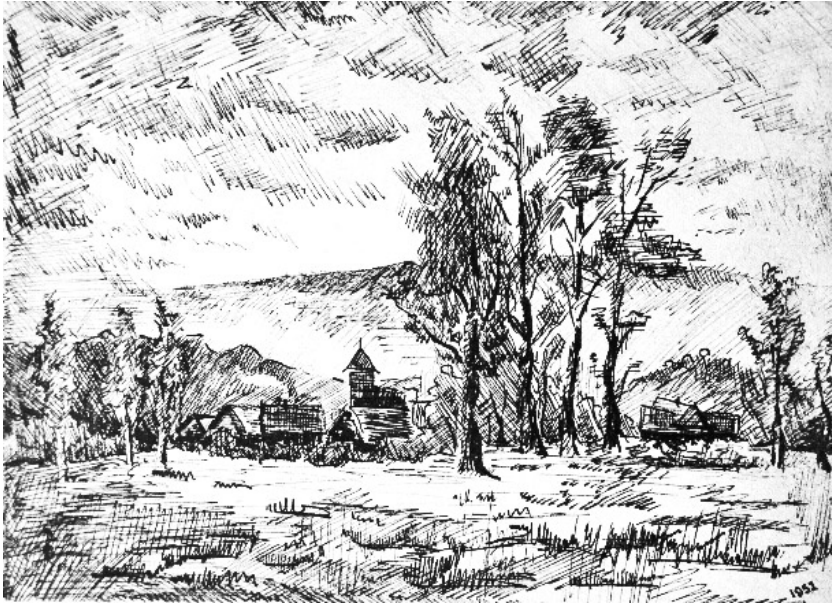
Táj templommal (1952)