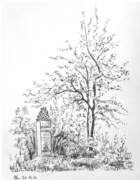
Szenci Molnár Albert sírja (1956)