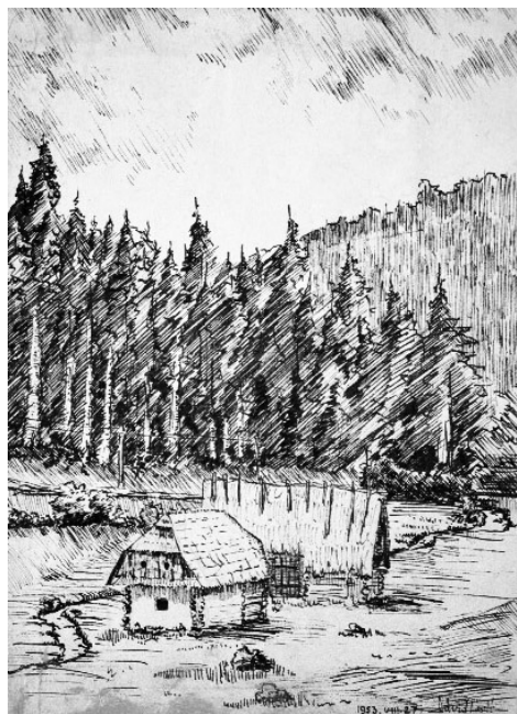
Havasi táj (1953)