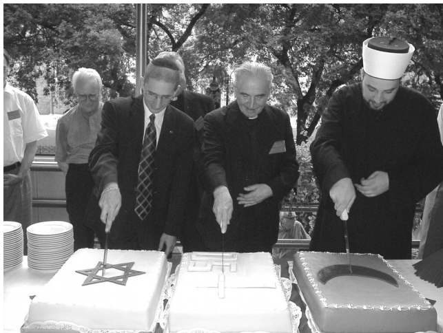
A vallások „édességei”

A végítéletet a muszlimok is várják, amikor Isten a cselekedetek alapján ítéli meg az embereket. A Koránban 114 szúra (fejezet) található, amelyek hosszúságuk szerint sorakoznak egymás után. A korábban keletkezett mekkai szúrák inkább eszkatologikus prédikációk, a később íródott medinai szúrák inkább egy közösség életét rendező jogi és praktikus intézkedések.