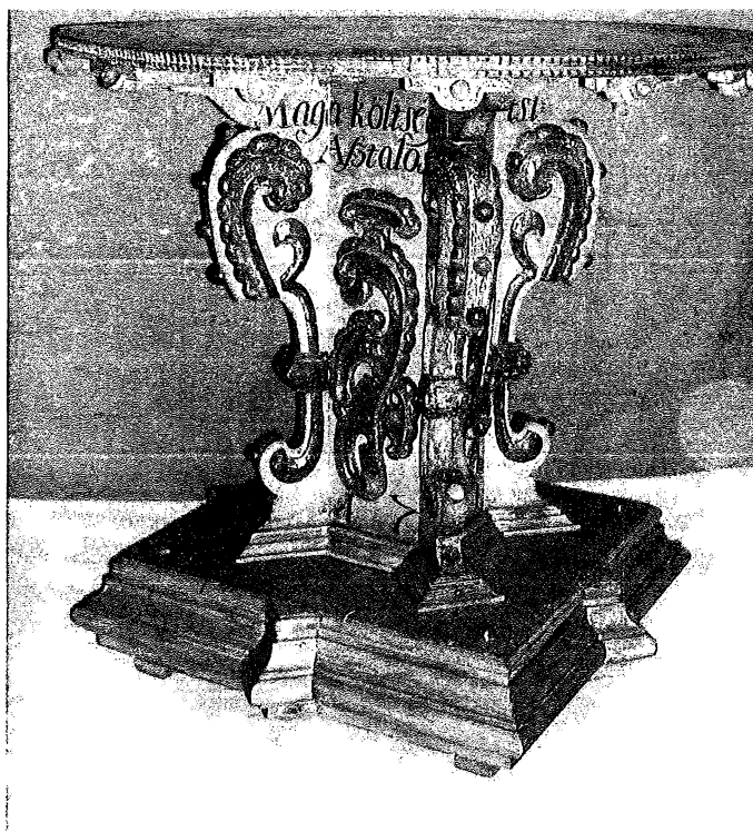
A bibarcfalvi úrasztala a felújítás előtt