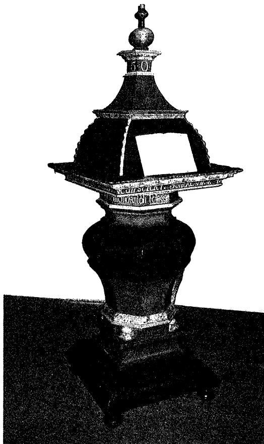
A Marosvásárhelyi Református Vártemplom éneklőszéke a felújítás után

Az Erdélyi Református Egyházkerület folyóirata