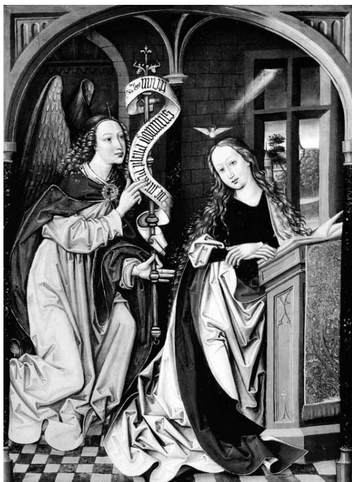
Angyali üdvözlés. Részlet a lőcsei Szent Jakab templom Vir Dolorum oltáráról (1476–1478). (Jankovics Marcell–Méry Gábor: A lőcsei Szent Jakab templom szárnyasoltárjai. Méry Ratio Kiadó, 2007. 60.)

laton kívüli berendezési tárgy „liturgiai rehabilitálásáról”. Az utóbbi években elindult alapos felmérési munka, mely az Egyházkerület különböző részeinek levéltári és tárgyi felmérését tűzte ki célul, újabb és újabb adattal, pontosítással szolgál a témakörben. 9 Az éneklőszékek kutatásához közvetlenül kapcsolódik az egyházi textíliák kutatása, 10 ugyanis az éneklőszékeket legtöbb esetben díszes takaróval, terítővel látták el. Általában a terítő maga többet ért az elfedett bútornál, ezért a vizitációk, a leltárak inkább az előbbiekről emlékeznek meg. Egy adott templom vagy gyülekezet esetében, ha éneklőszékterítőt készítenek vagy készíttetnek, akkor magától érthető, hogy volt éneklőszékük is. A terítők méreteiből, formáiból sok esetben fontos következtetések vonhatók le. De ugyanakkor a díszes takarók különböző korokban való készítése nem minden esetben vonja maga után az éneklőszék használatát. Talán a legszembeűnőbb példát az ördögösfüzesi református templom mutatja, ahol az elmúlt száz évben, beleértve a közelmúltat is, több (10 darab!) éneklőszék terítő készült,