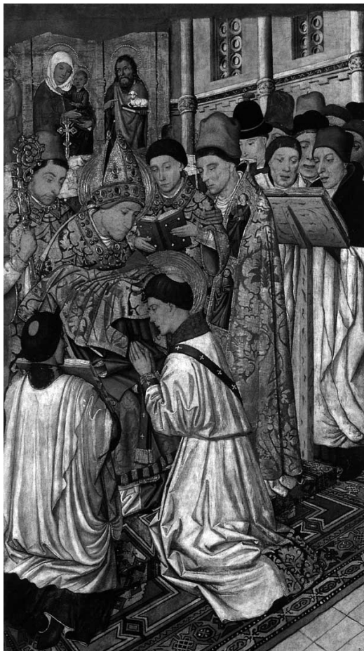
Részlet Jaume Huguet Szent Vince oltáráról (1458 körül). Barcelona, Museu Nacional de Arte de Catalunya. ( Gótikus stílus. Építészet. Szobrászat. Festészet. 458.)

Hasonlóan ugyanide helyezik, esetenként a keresztelő medence közvetlen szomszédságába, a második típusba sorolt, fából készült, faragással, festéssel díszített felolvasó pulpitusokat is, amelyek magas, egyszemélyes padmellvédre hasonlítanak. 14 Néhány templomban a fent bemutatott formáktól eltérően vékony, filigramm, állványszerű könyvtartót láthatunk. 15 Külön kiemelnénk a székelyzsombori magyar evangélikus templomban található tárgyat, amely felépítése, forgatható, kétsíkú könyvtartó része és magyar nyelven írt zsolnáridézete alapján szinte elválaszthatatlan a református és unitárius templomokban található éneklőszékektől.