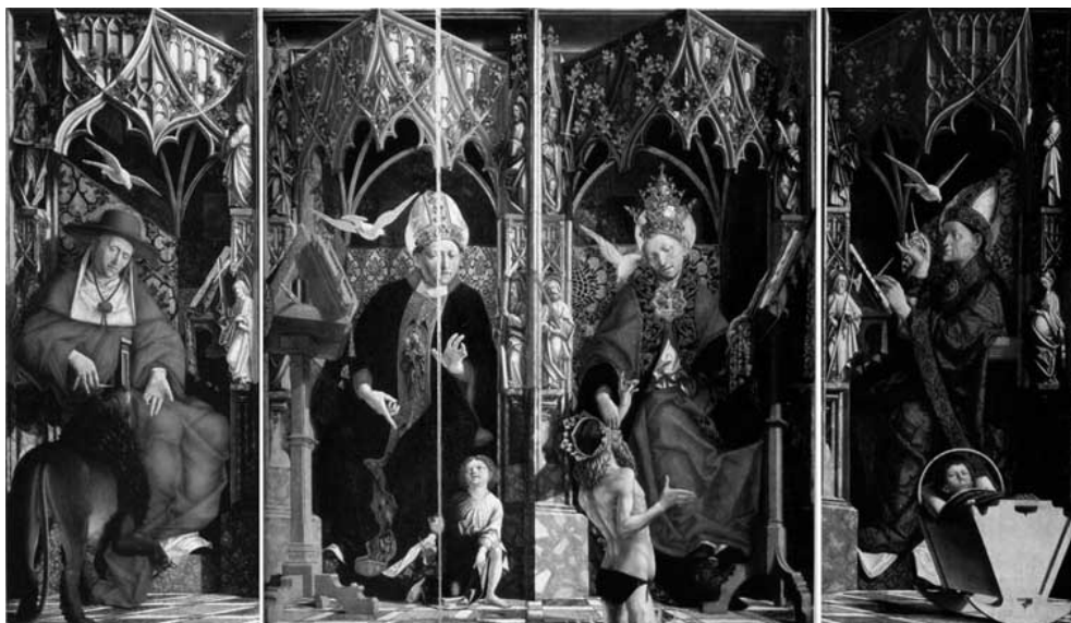
Részlet Michael Pacher Egyházatyák oltáráról (1467–1483). München, Alte Pinakothek. (Camillo Semenzato: Dicsőleges Reneszánsz. Mesterek és remekművek. 1993, 136–137.)

Funkcióját tekintve talán a legközvetlenebb kapcsolat, illetve folytonosság azoknál az énekeskönyvtartóknál, éneklőszékeknél látható, amelyek olyan ábrázolásokon jelennek meg, ahol énekes misét, szerzetesi kórust vagy éppen éneklő angyalokat láthatunk. Formájukat tekintve a négyzet vagy háromlábú típustól a legegyszerűbb könyvtartó állványig, valamennyi változatát föllelhetjük.