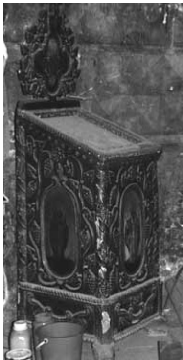
Ikontartó állvány. Ortodox kolostortemplom, Arbore