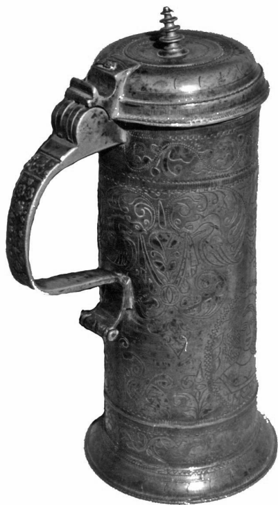
5. Ónkanna (Beregszász Kárpátalja, Kolozsvár, XVII. század, WK mester munkája, Nagybégány)

bortartó edény, boroskanna használata is, amely így bekerült az úrasztali felszerelési tárgyak közé.