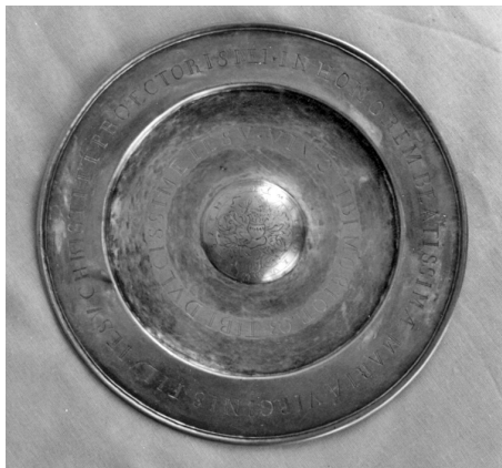
4. Kenyérosztó tál (Fertősalmás, Kárpátalja, Szatmárnémeti, XVII. század, Gregorius Eötvös Zegeði alias Karachon)

A használati, elsősorban asztalneműként ismert ónedények különösen jelentős helyet foglalnak el napjainkban is a református egyház szertartási tárgyai között. Az ónból készült edények között általános forma az ónkanna. Mivel az úrvacsoraosztás két szín alatt történik, a hívek a Jézus testét jelképező kenyér mellett részesülnek a Jézus vérének jelképező borból is, ezért szükségessé vált egy nagyobb