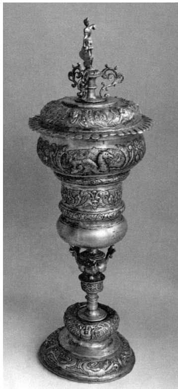
3. Serleg (Viski, Református Egyházközség, Kolozsvár, XVII. század, Michael Werner vagy Matthias Werner munkája)

Megtaláljuk az úrasztali borospoharak között a kor kedvelt kehelyformáit a gótikától kezdve a 20. század elejéig. A későreneszánsz, majd a barokk sajátossága volt a különlegességekhez való vonzódás (3. kép). Az ötvösségben a 16. század végén, a 17. század elején jelentek meg a nemesfémfoglalatú ellátott kókuszdióból készült ún. kókuszdió-serlegek, amelyek európai különlegességük miatt váltak az ötvösség alapanyagává.