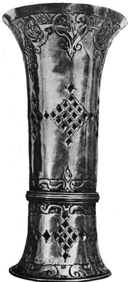
4. Talpas pohár Biharpüspöki; Pesti Máté vagy Pesti Mihály munkája

A református egyház következő szertartási tárgya a kenyérsztó tál. A jákóhodosi gyülekezet hatszögletű tányérja ennek a kevés formai lehetőséget adó tárgytypusnak jellegzetes 17. századi reneszánsz változata. MB jelzése alapján ugyancsak debreceni ötvös a készítője, Miskolci Bálint, akinek keresztelőkannája a 17. századi debreceni ötvösség egyik kimagasló alkotása. 12