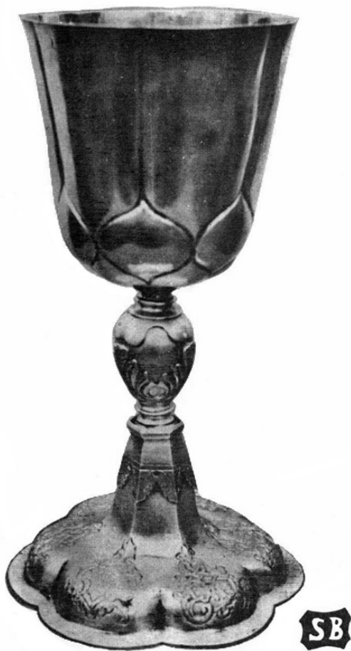
5. Hólyagos pohár Jákóhodos; Büttösi István II. munkája

Békési családnéven négy mester szerepel a 18. század folyamán. Békési Sámuel jelentős alakja volt a 18. század eleji debreceni ötvöscéhnek, jelenleg 15 fennmaradt művét ismerjük. Tőle származik az egyetlen debreceni asztali ezüst edény, egy cukortartó. Az általa készített két úrasztali pohár, egy hólyagos pohár és egy sima oldalú kehely Örvendről és Értarcásról való. 15