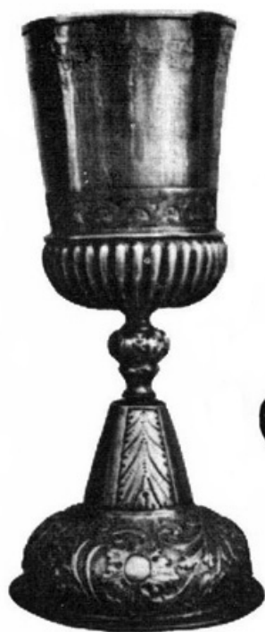
7. Kehely Nagyszalonta; Tótfalusi Gábor munkája