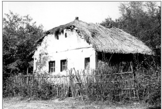
Melegföldvári öregház (Fotó: Adorjáni Zoltán, 1982)

Úgy kerültem Melegföldvára és leánygyházközségébe, Katonába, hogy egy jó ideig csak beszolgáló lelképásztoruk volt, és a gyülekezet hívei, akik azelőtt jó templomlátogatók voltak, és mind a mai napig azok, elszoktak a