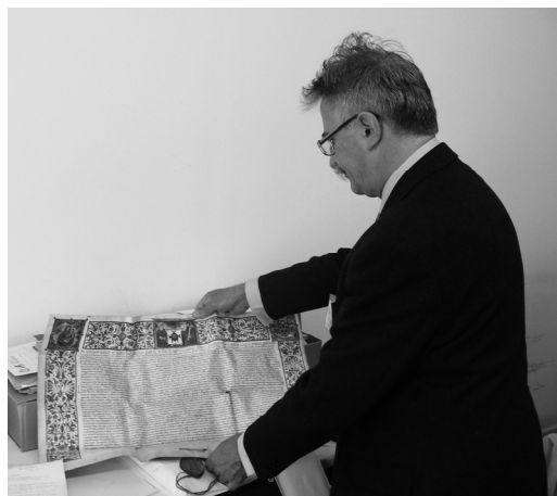
Az 1518-as pápai brevé