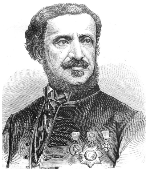
Szathmári Pap Károly (1812–1887)

Mikor 1812. január 11-én keresztvíz alá tartották a kis Károlyt a reformátusok templomában, még élt nagybátyja, Szathmári Pap Mihály (1737–1812), a Református Kollégium nagytekintélyű, hollandiai egyetemi körökben