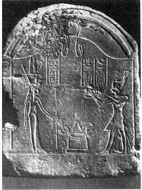
Schuller, Frauen, Abb. 25: Ptolemaios II. bringt seiner als Göttin angesehenen Frau ein Opfer dar.