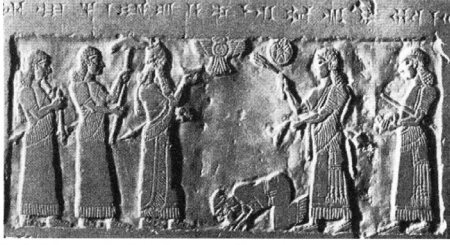
König Jehu vor König Salmanassar liegend