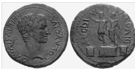
MACEDON, Philippi. Augustus. 27 BC-AD 14. Æ 25mm (9.02 g). Laureate head right. Three bases: center base with statues of Divus Augustus (on left) crowned by Divus Julius, Augustus wearing military attire and Julius wearing toga. RPC I 1650 27 .

ség világa, érdekes megjegyzést fűz a Fil 2,9–11 igeszakaszhoz. Azt feltételezi, hogy filippibeli gyülekezet tagjai előtt egy olyan rendkívüli szemléltetőeszköz állhatott, amely hozzásegített őket a Krisztus-himnusz megértéséhez; éspedig az a pénzérme, amelyet éppen Filippiben vertek nekik címzett apostoli levél megírásának idején. A pénzérme felirata és grafikai ábrázolása Augustus császár istenné emelését juttatja kifejezésre. A pénz ismeretét feltételezve, Pál apostol bizvást beszélhetett előttük Krisztus felmagasztalásáról.