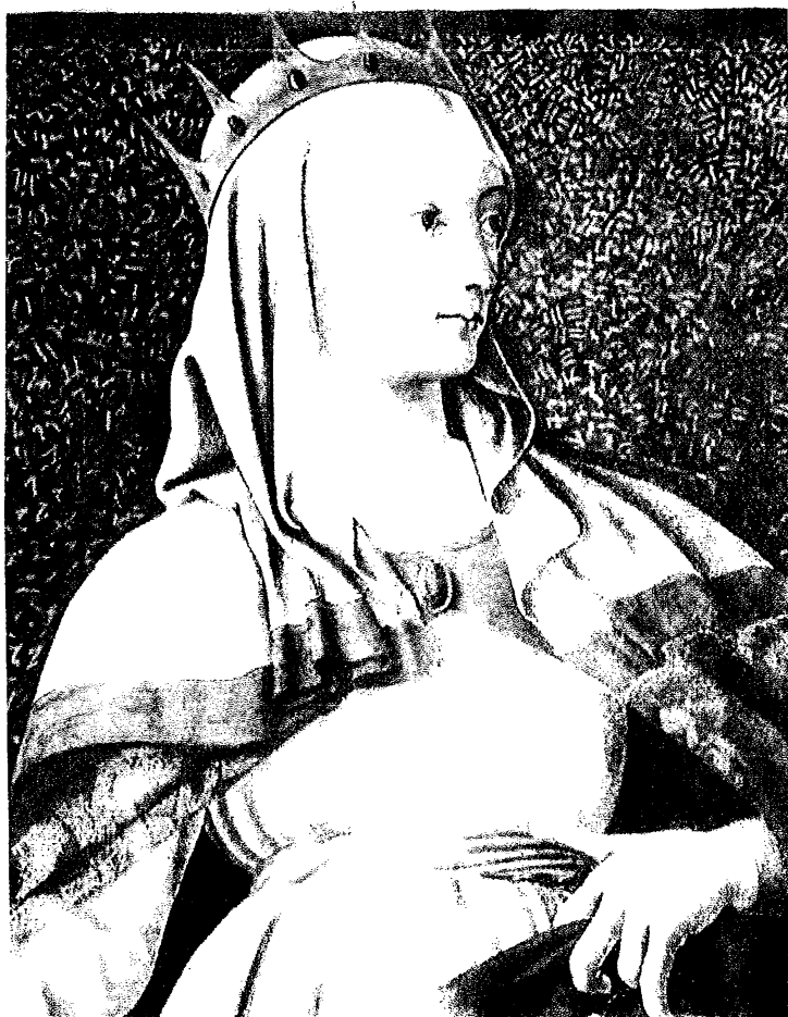
Andrea del Castagno: Eszter királyné

Az Erdélyi Református Egyházkerület folyóirata