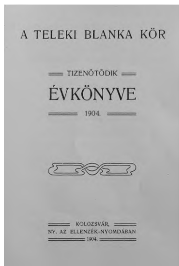
A Teleki Blanka Kör 1904-es évkönyve

A Teleki Blanka Kör évkönyvei 1890-ben indulhattak, Kolozsvárt az V. évkönyvtől (1894) a XV. évkönyvig (1904) található öt füzet. 51 Ezekben szerepel a kör tagnévsora, az elmúlt évi tevékenység összefoglalása, rendszerint az elnöknő közgyűlési beszéde áll az élen. Mindegyik tag a közgyűlésen beszámol arról, hogy mi jót tett: egy kisfiút megtanított írni-olvasni, valakinek könyvet ajándékozott, szegény gyermeket felöltöztetett, egy ifjúsági olvasmányt magyarra fordított, egy falusi ünnepséget szervezett. 1893. december 5-én megalapították a kolozsvári állatvédő egyesületet. Kossuth-szoborra, Teleki Blanka-emléktáblára gyűjtöttek. A tagságdíj 2 korona volt. Ezt részben arra akarta fordítani az elnöknő, hogy 1898-tól egy-egy pályázat útján kiválasztott tehetséges fiatal tanítónőnek párizsi tanulmányutat biztosítsanak. A pénz többi részét kiadványokra költötték. Az 1904-es XV. évkönyv már 215 tagot tart számon, de csak 70-en fizették be a rendes tagságdíjat. Néhányan azonban gyűjtöttek, és így felülfizettek. 1905-re jelenhetett meg a XVI. évkönyv, amelyet megküldtek a Budapesti Naplónak , s az egy Ady Endrének tulajdonított (aláíratlan) kis ismertetést közölte róla: Egy szomorú évkönyv . 52 Azért szomorú, mert szerkesztője bejelenti, hogy utolsó, ugyanis távozni fog Kolozsvárról, s így a kör megszűnik.