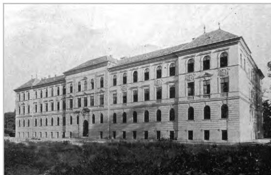
A felsőbb leányiskola új épülete