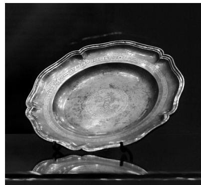
Aranyozott ezüst kenyérosztó tányér, 1756, ISB mester. A Sáromberki Református Egyházközség tulajdona.

A tárlat az úrasztali edények, textíliák és levéltári források által kíséri végig egy-egy vidék reformációját. A tárgyi anyag három nagyobb téma köré csoportosul. Az első teremben a széki területek egyházközségeinek történetét láthatjuk a századok szerint rendezett tárlókban, majd a magyar többségű erdélyi városok református gyülekezeteinek élete elevenedik meg. Ezek a gyülekezetek politikai kivált-