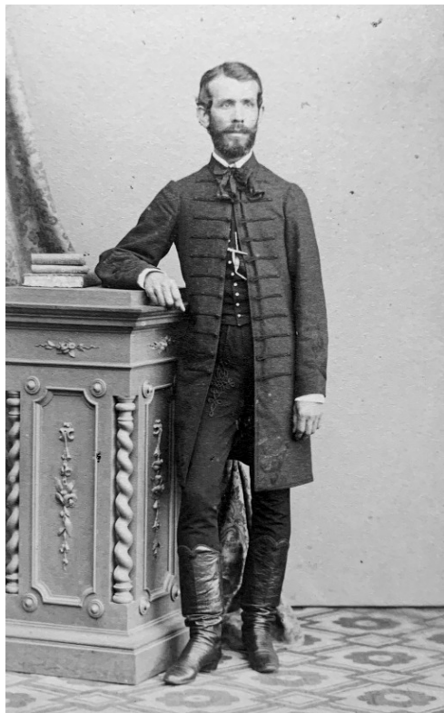
Buzogány Áron (1833–1888)

Megköszönte a magyar unitáriusok iránt megnyilvánuló rokonszenvet, és azt, hogy vállalták az unitárius oktatás fenntartásának anyagi támogatását. Kegyelettel emlékezett Tagart küldetésére, és biztosította az angolokat, hogy néhai titkáruk emlékét mindaddig fogják ápolni Erdély bércei közt, míg egyetlen unitárius él a hazában. Buzogány is felszólalt a közgyűlésen, beszédében a magyar unitarizmus küzdelmes történetét vázolta. 21