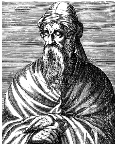
Küroszi Theodórétoz (393–458)

A szöveget 65 oldal terjedelmű bevezető tanulmány előzi meg, amelyben a szerző részletesen mutatja be Theodórétoz művét, szól a datálás kérdéseiről, a Theodórétoz által használt bibliai szöveg típusáról, illetve ismerteti és rangsorolja művének szövegtanúit is. A szerzőség kérdéséhez kapcsolódó legújabb szakvéleményeket szem előtt tartva a negyedik könyv Nesztorioszról szóló, utolsó előtti fejezetét Pszeudo-Theodórétoz: Contra Nestorium ad Sporacium címen közli, mint olyan szöveget, amely nagy valószínűséggel nem tulajdonítható Küroszi Theodórétoznak.