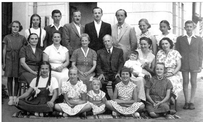
Családi összejövetel a kolozsvári teológia udvarán az 1950-es években