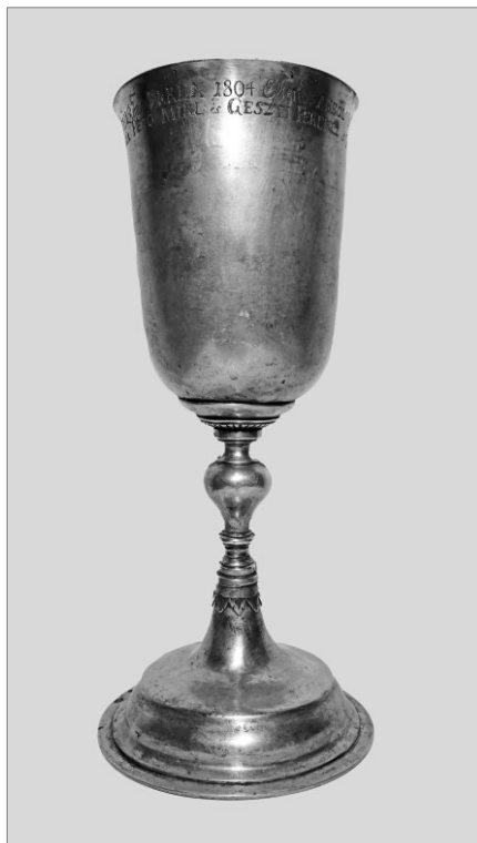
Az érkeserői kehely

Az érintett személyek mindannyian a református egyház tagjaként ismertek, a Horváthok pedig Keserű földesuraiként voltak a helyi református egyházközség patrónusai. Ennek több bizonyítékát ismerhettük meg a család történetén keresztül: a templomban temetkeztek, és földeket adományoztak egyházuknak. Mindez teljes összhangban van az ezüst tányér ajándékozásával. Ugyanakkor azt is feltételezhetjük, hogy a Horváthok az említetteken felül is támogatták