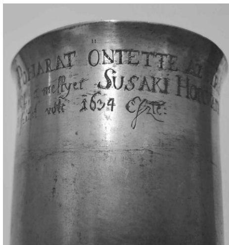
Az érkeserői kehely, részlet